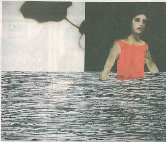
"Major Minor III", olja.