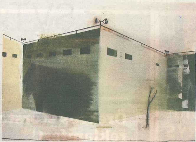
"Det stod i tidningen", olja.