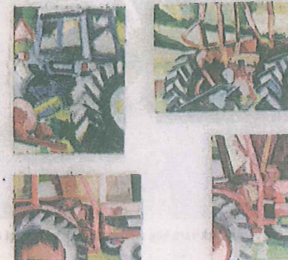
Oljemålningar med traktormotiv av Åsa Leanderz, som ställer ut nästan vägg i vägg med sin ateljé.

Värmland, närbilder av blommor och detaljer på traktorer.