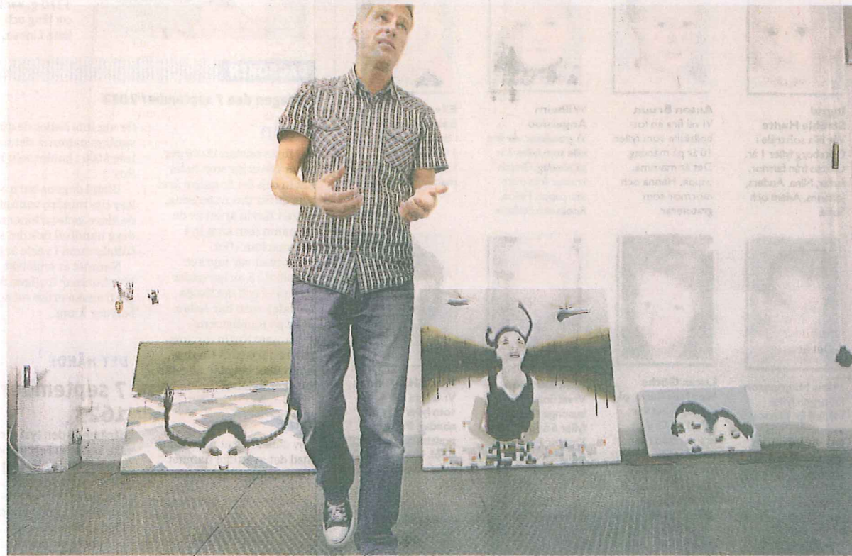
Jesper Blåder vill att hans bilder ska berätta något; att det finns ett före och ett efter. Flera av målningarna föreställer flickor med flätat hår.

jenni.ahlin@mariestadstidningen.se 0501-687 42